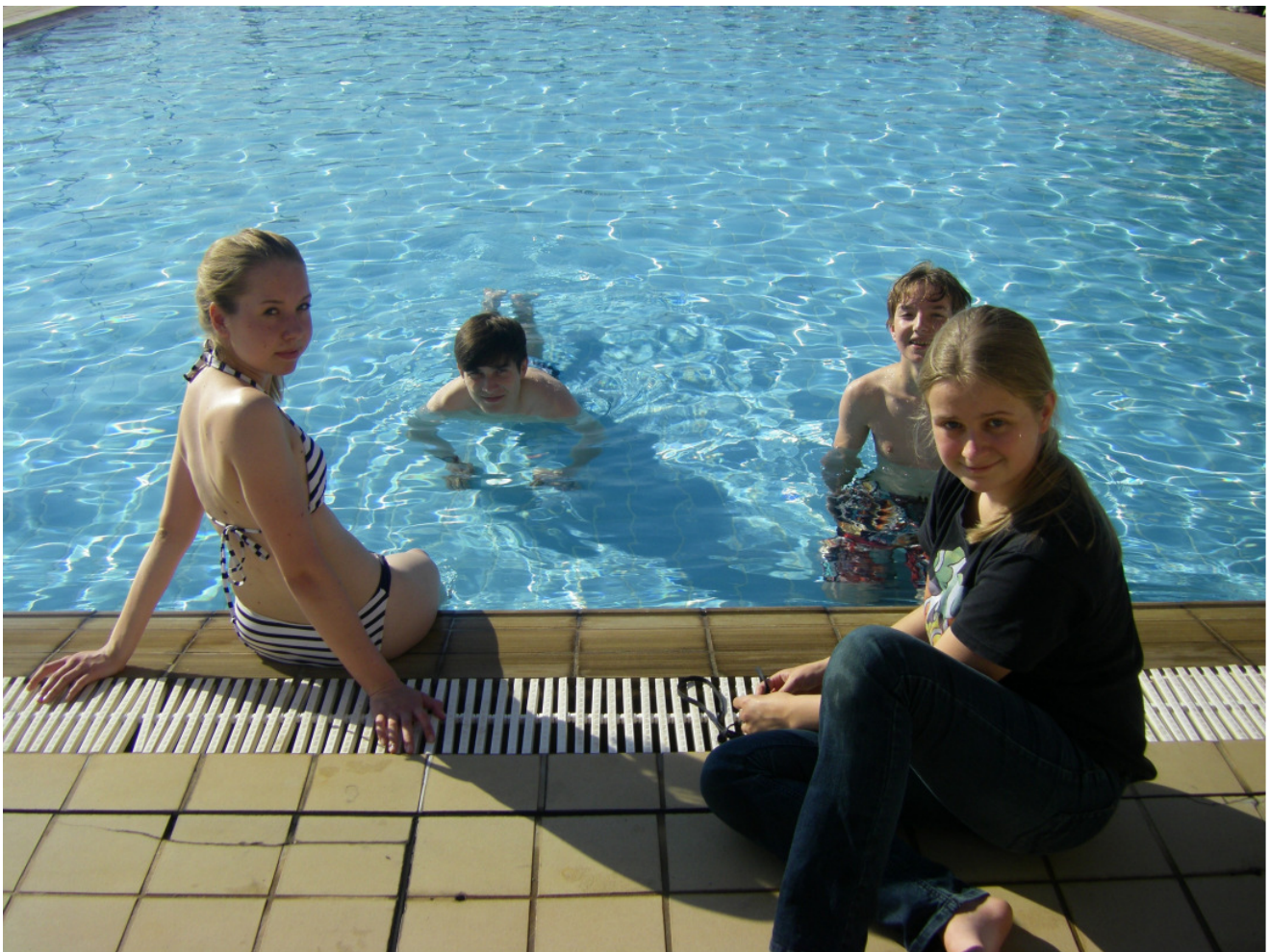
Bei jedem Austausch wird für alle teilnehmenden brasilianischen und deutschen Schüler (insgesamt ca. 300) eine Grillparty veranstaltet, bei der auch die Sportanlagen der Schule genutzt werden.