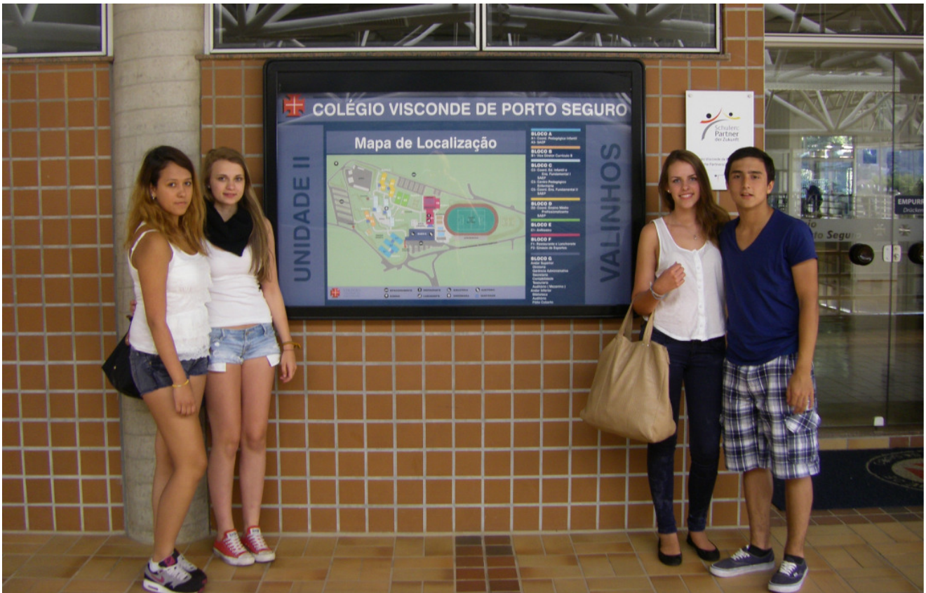
Am Eingang der Aula der Porto-Seguro-Schule in Valinhos