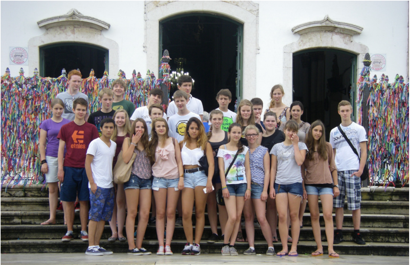
Die Duisburger und die Mindener Gruppe vor der Bomfim-Kirche in Salvador, wo man die berühmten Glücksbändchen bekommt.

Bei jedem Austausch werden mit den Schülern in Brasilien zwei fünftägige Reisen unternommen: Eine führt in den Norden des Landes, nach Salvador da Bahia und Praia do Forte, die zweite nach Paraty und Rio de Janeiro.