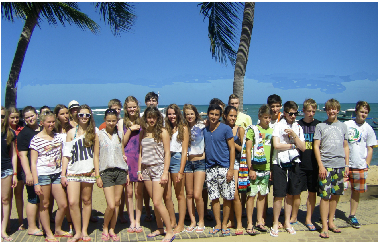
Unter Palmen in Praia do Forte