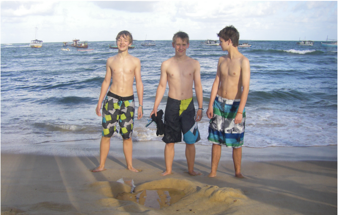
Badevergnügen in Praia do Forte